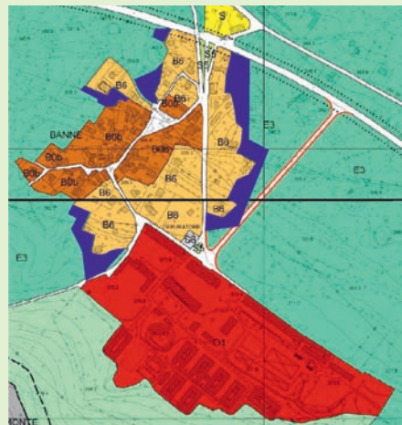
Bani, na povzetku iz urbanističnega načrta je razvidna ogromna površina bivše vojašnice (temno rdeča barva), v modrem domačinom odvzete zazidljive površine.

Ob coni pri Banih, ki je najbolj surov poseg na teritoriju, je tu še mnogo spornih izbir. Najbolj očitna je nova turistična cona zraven Padrič. Glede le - te obstaja sum, da se za njo skrivajo špekulacije. Prav verjetno je, da je le neke vrste trojanski konj za ponovno gradbeno špekulacijo, podobno tistim pri Briščikih (naselje "Girandole"), Pesku (bivši motel "Val Rosandra"), Miljah ("Marina Muja"), Nabrežini (zaliv in bivši hotel "Europa"). Vsi ti primeri imajo skupni imenovalec