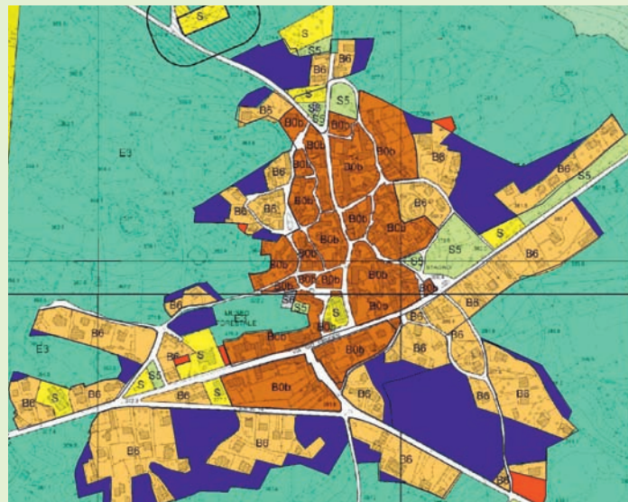
Bazovica je eden najbolj zgornjih primerov oškodovanja domačinov. Brisane zazidljive površine v vasi (v modrem) merijo skupno kar 92.000 m 2

v novih bivalnih naseljih pod krinko turistične namembnosti. Ena najlepših cvetk je tudi parkirišče na bivši državni cesti 202 na Opčinah, ki ga je podjetje kupilo na dražbi za smešno nizko ceno, ob tem pa so ji z novo zazidljivo cono B6 podarili še dober milijonček evrov. Županu so zaradi odkrivanja teh ne ravno "ortodoksnih" poslov v določenem trenutku popustili živci, saj me je na straneh italijanskega tržaškega dnevnika jezno in ostro napadel.